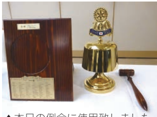
▲本日の例会に使用致しました。

日本のロータリー 100周年実行委員会では、「日本のロータリー 100周年」を共に祝い、次の世紀に向けてクラブの将来ビジョン・戦略計画を考える絶好の機会として活用して頂きたいとのことです。