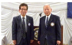
● PHF + 6