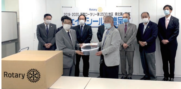
▲福島市医師会へフェイスシールド贈呈

6月5日(金) 福島市内5クラブとガバナー補佐事務所は福島市医師会、6月10日(水) 二本松市内2クラブとガバナー補佐事務所は安達医師会にそれぞれフェイスシールドを寄贈しました。