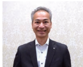
■東京海上日動火災保険(株) 福島自動車営業部長