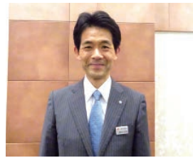
■東北電力(株) 福島支店長