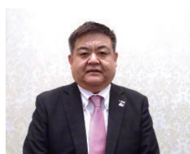
■あいおいニッセイ同和損保(株) 福島自動車営業部長